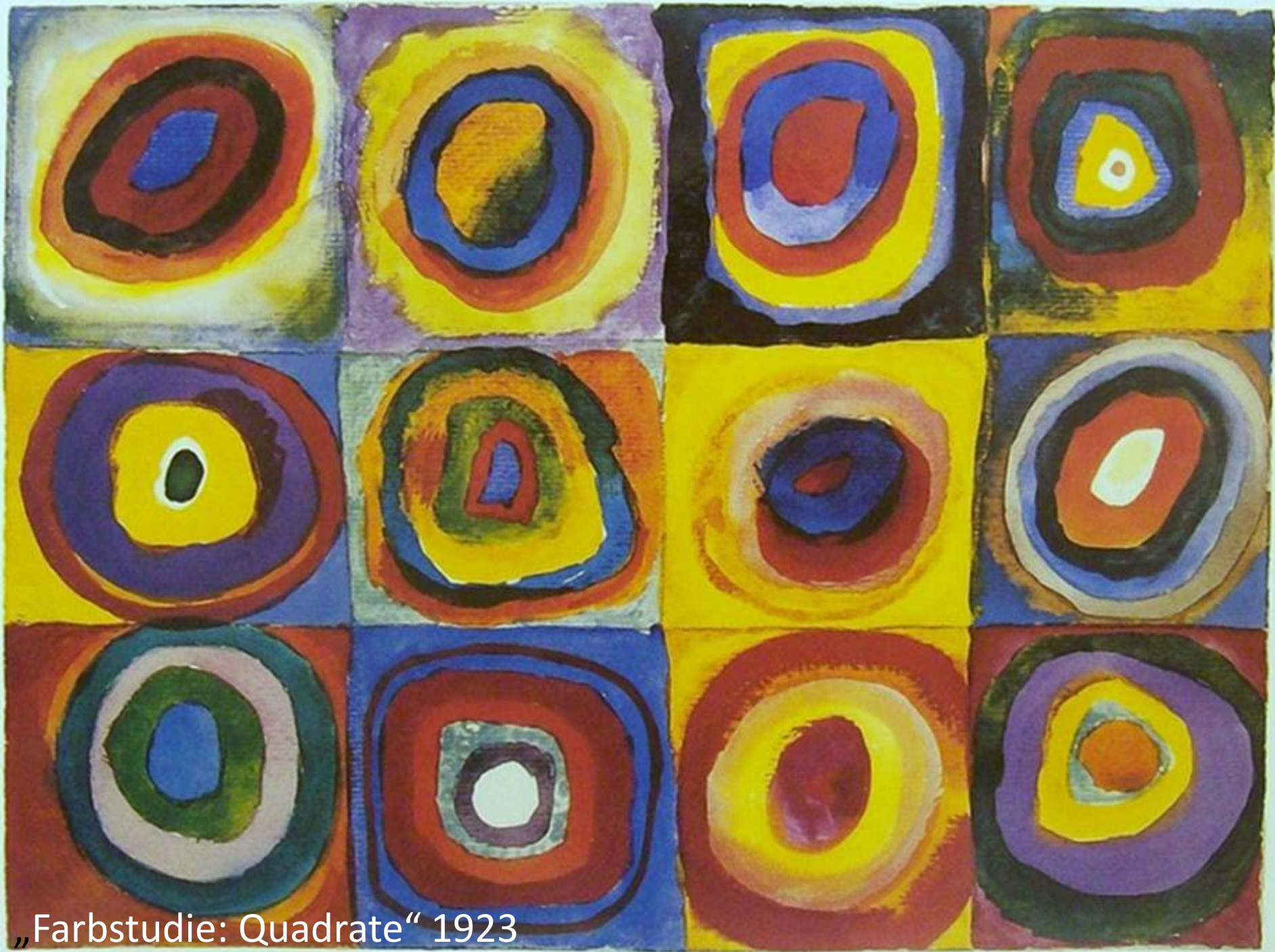
„Farbstudie: Quadrate“ 1923