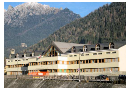
La Sede dell'Istituto di Istruzione Superiore a Transacqua